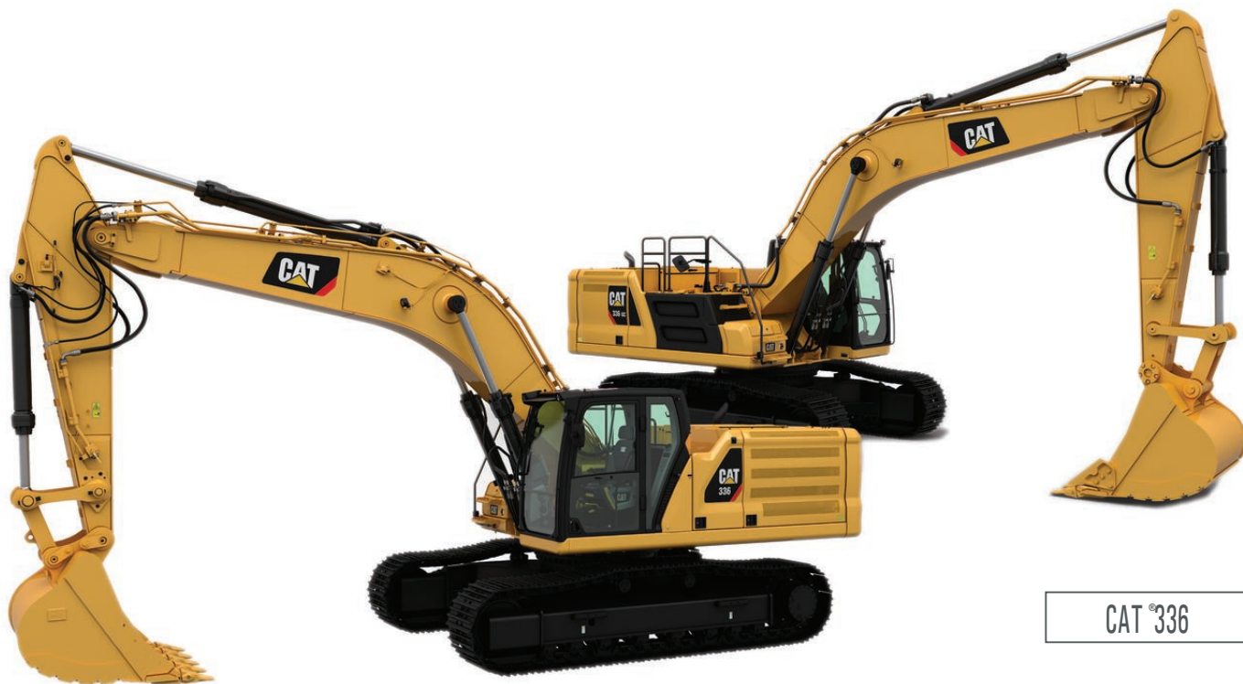
CAT 336 GC