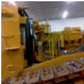
Kompleti i ri i rindërtimit të motorit Cat 3406 që përdoret për një riparim të përgjithshëm të motorit në Poloni.

Motori i makinës suaj Cat ndërtohet për një jetë të dytë, madje të tretë. Tani është më lehtë sesa kurrë më parë për t'i dhënë jetë të tjera me anë të kompletit tonë të rindërtimit të motorit. Pjesët që ju nevojiten për të rindërtuar motorin tuaj siç duhet disponohen në një komplet të lehtë për tu porositur, dhe me kosto efektive që ju kthen në punë shumë shpejt. Me performancën shumë të mirë dhe jetën e gjatë që pjesët e vërteta Cat mund të japin. Katër nivele të ndryshme të completeve janë të disponueshme. Cilindo opsion që zgjidhni – Bronz, Argjend, Ar ose Platin – secili komplet në vetvete dhe në kombinim me pjesët e lidhura përfshijnë komponentët e kërkuar për të plotësuar një riparim të përgjithshëm, për nevojat tuaja specifike. Ju kurseni kohë dhe para dhe fitoni njohuri shtesë. Secili komplet mbështetet në një garanci Caterpillar – pavarësisht se kush e kryen punën.