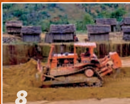
8 Počnite graditi cestu.