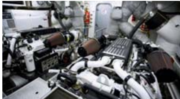
Një Cat® motori detar i instaluar në një Jaht të Princeshës.

Me suksesin e Cat Concierge për anijet private për kënaqësi, servisi po zgjerohet tek anijet tregtare. “Njerëzit në anën tregtare mësuan për Cat Concierge dhe kanë kërkuar një program që t’ju përshtatej atyre,” tha Shane. “Dallimi është se ne jemi marrë me pronarët e flotave, si një autoritet portual me 100 ose 200 anije në vend të pronarëve individualë privatë.” Caterpillar sapo përfundoi një seminar për të përshtatur procesin për çështjet kyçe në segmentin e marinës tregtare. Ky proces do të pilotohet me dy ose tre çështjet kyçe më vonë në 2013.