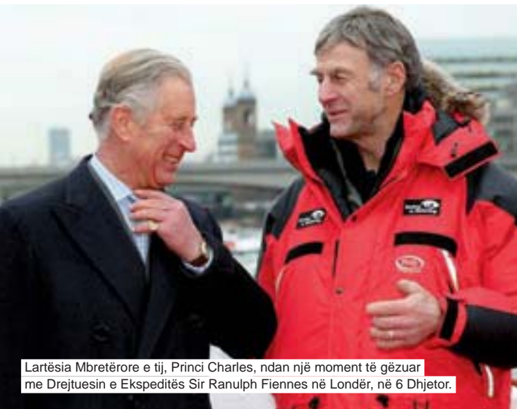
Lartësia Mbretërore e tij, Princi Charles, ndan një moment të gëzuar me Drejtuesin e Ekspeditës Sir Ranulph Fiennes në Londër, në 6 Dhjetor.