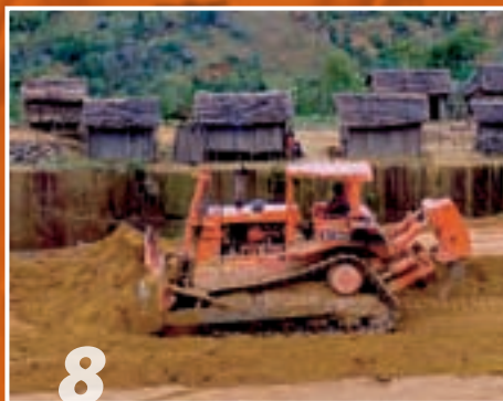
8 Početak izgradnje puta.